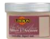
Peinture à l'Ancienne Rouge fatal