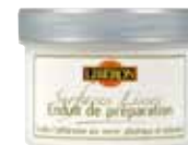
Enduit de préparation Surfaces lisses