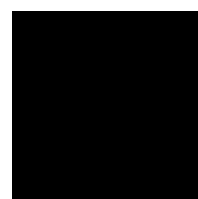
Noir de lave